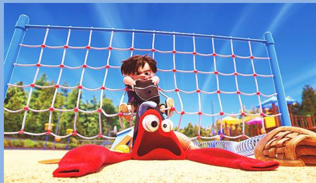
Lou- cortometraggio Pixar