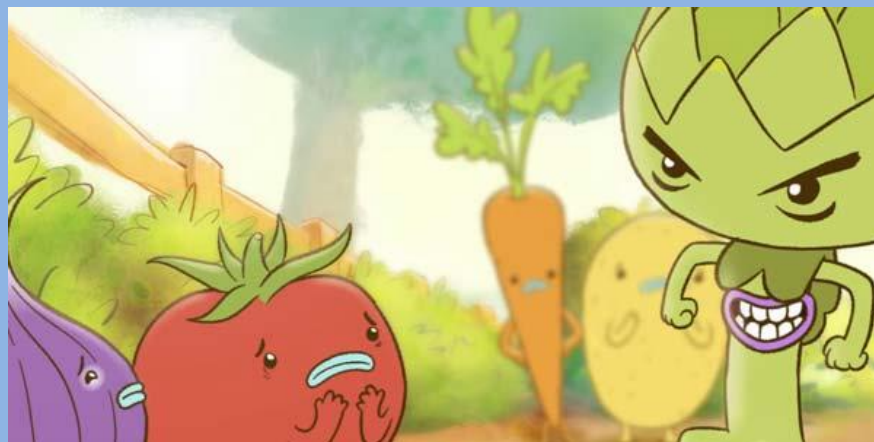
Quel bulletto del carciofo- brano dello Zecchino d'oro